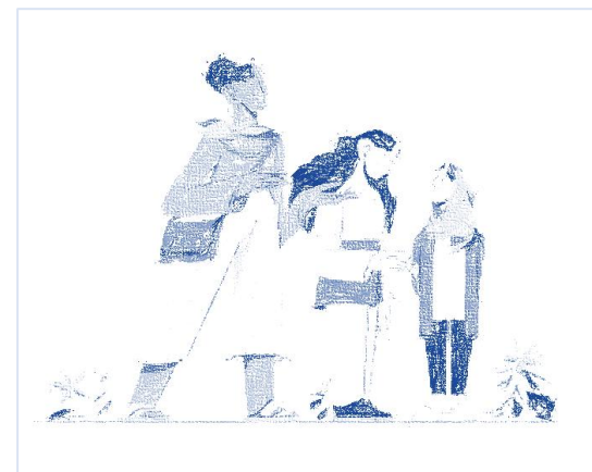
Ilustración de Mujer y Sociedad. Diseñada en 2022 por la creadora gráfica Alicia Blasco, colaboradora de la empresa Uxing SL, España.

La esperanza se basa, en definitiva, en nuestro derecho a contar con instituciones confiables puestas al servicio del bienestar colectivo y el desarrollo de los consensos por la igualdad.