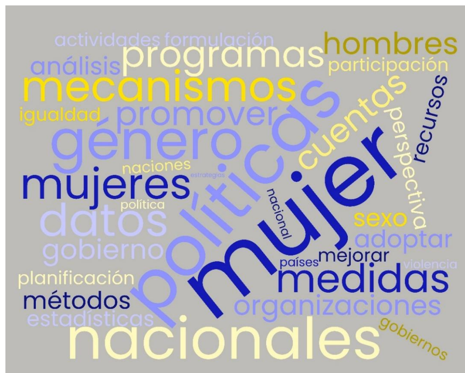
Wordcloud. Área de especial preocupación H (Mecanismos) de la PAB de 1995.

Organismos como Transparencia Internacional y la Convención de la ONU contra la Corrupción trabajan para fortalecer los marcos de integridad.