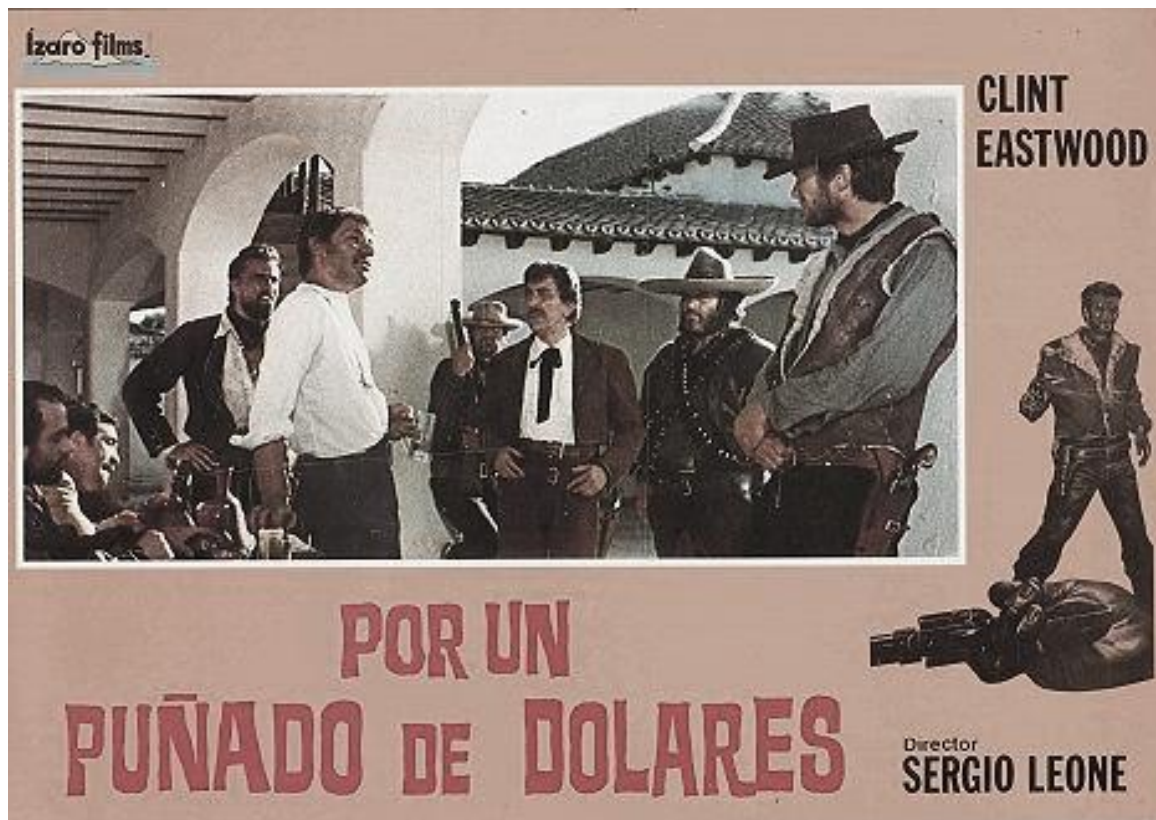
Imagen de la Película “Por un puñado de dólares” de Sergio Leone (1964), denuncia la falta de moralidad.