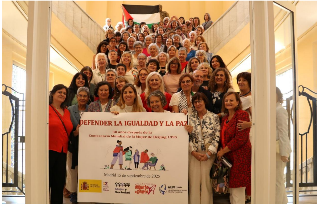
Participantes en el Encuentro 'Defender la Igualdad y la Paz', Círculo de Bellas Artes (Madrid 15.9.2025)