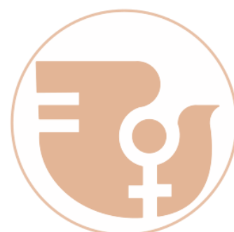
Logo de la IV Conferencia Mundial de las Naciones Unidas sobre la Mujer, Beijing, China, 1995

Por ello, en este mes, conmemorando Beijing+30, desde Mujer y Sociedad demandamos una sanidad pública con más personal y mejor cuidado, más ginecólogas, más llamadas de teléfono, más resultados a tiempo especialmente en áreas feminizadas como la atención primaria y la salud sexual y reproductiva.