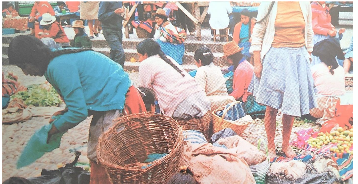
Estrategias económicas de supervivencia, contextos de informalidad y resistencias cotidianas. Perú 1991.