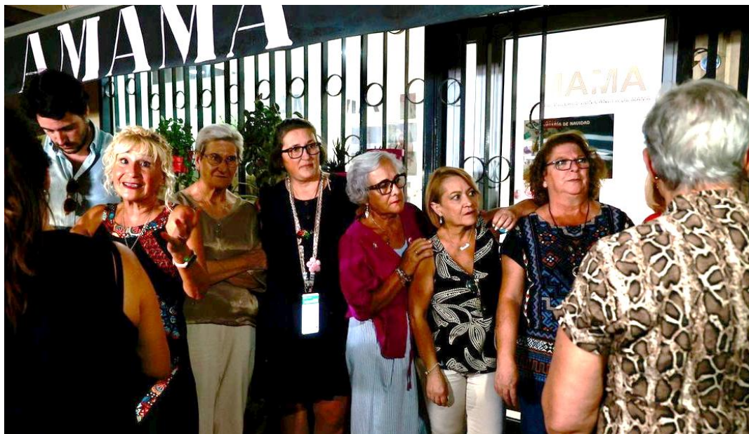
La Asociación de Mujeres con Cáncer de Mama de Sevilla (AMAMA) denuncia la sanidad andaluza.

Además, la pobreza puede empujar a muchas mujeres a situaciones de explotación sexual, violencia y dependencia económica, lo que pone en riesgo los avances sociales logrados en las últimas décadas