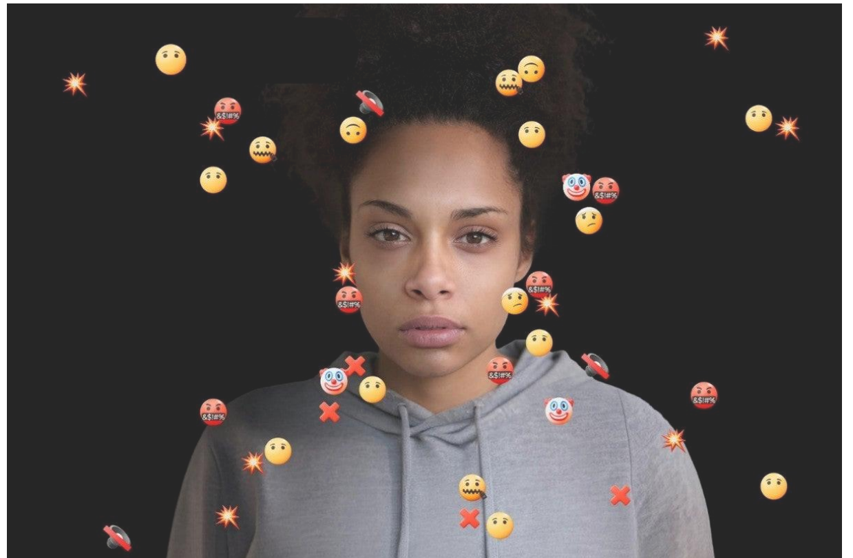
Foto: ONU Mujeres, 25 noviembre 2025- 16 Días de activismo contra la violencia de género [Página de inicio de ONU Mujeres]